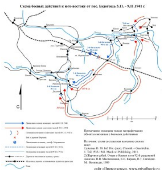
Схема боевых действий у юго-востоку от Будогощи 5.11.-9.11.1941 г.

Непосредственно захват разъезда 121 км. планировалось осуществить силами 1-го батальона и 10-й роты 3-го батальона, а 11-я рота 3-го батальона должна была ликвидировать пост у платформы Мордвиново [3, с. 215].